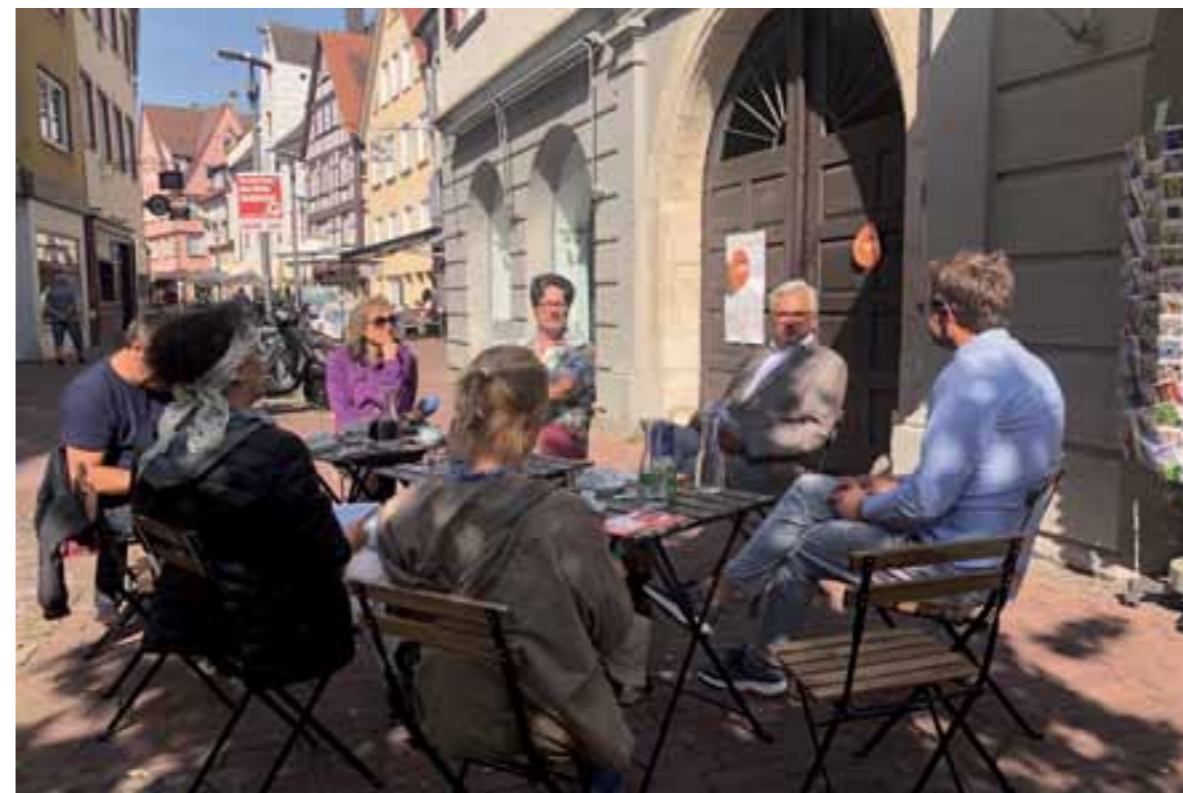
Pressegespräch mit Oberbürgermeister Gunter Czisch