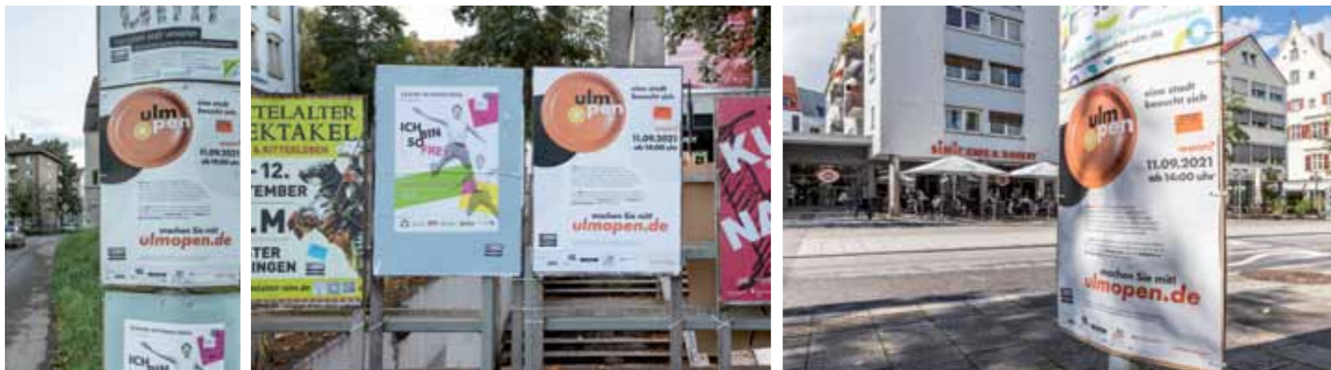
Plakatierung im Stadtgebiet