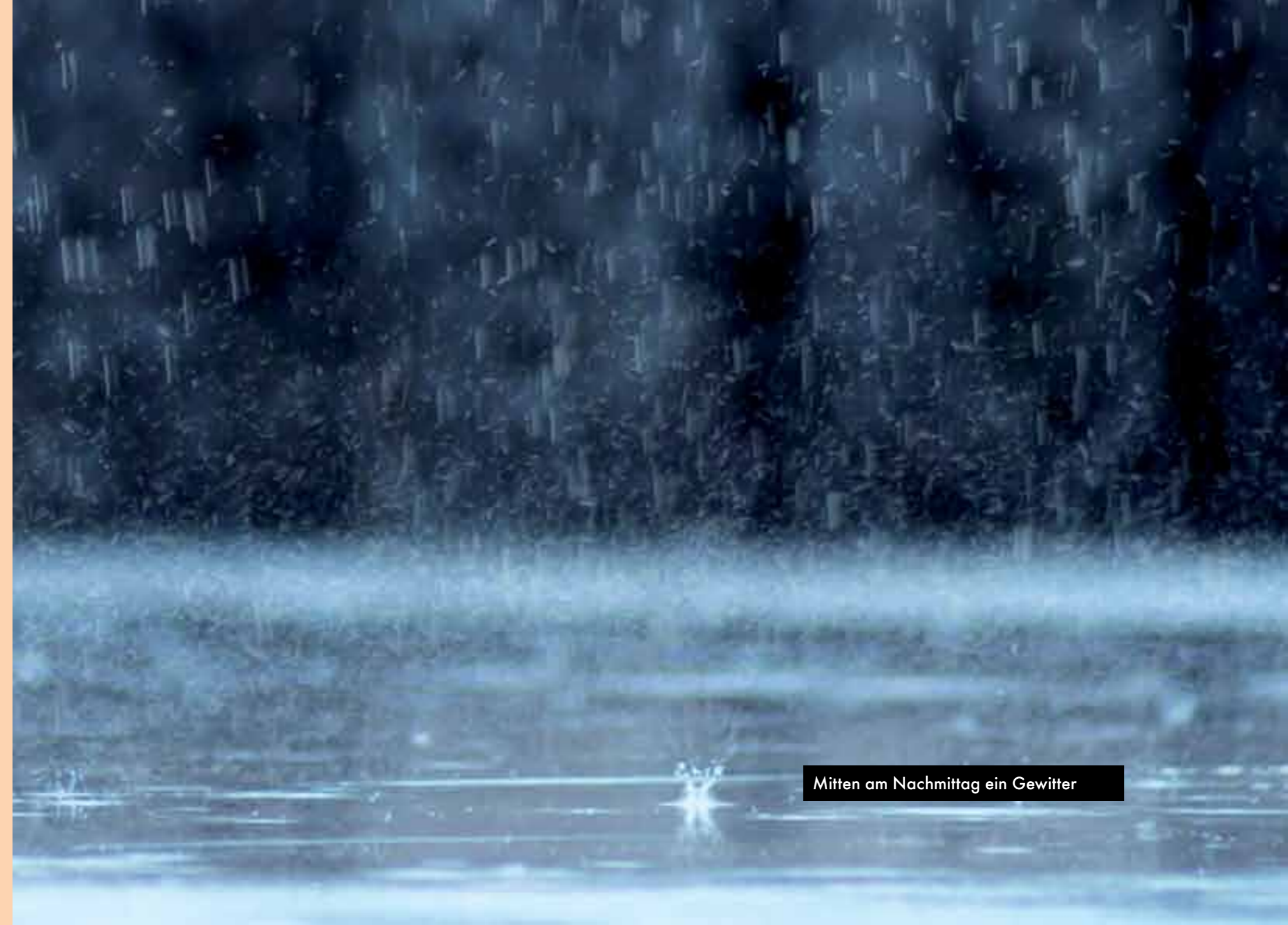
Mitten am Nachmittag ein Gewitter