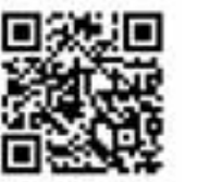
Trailer für Kino und Social Media