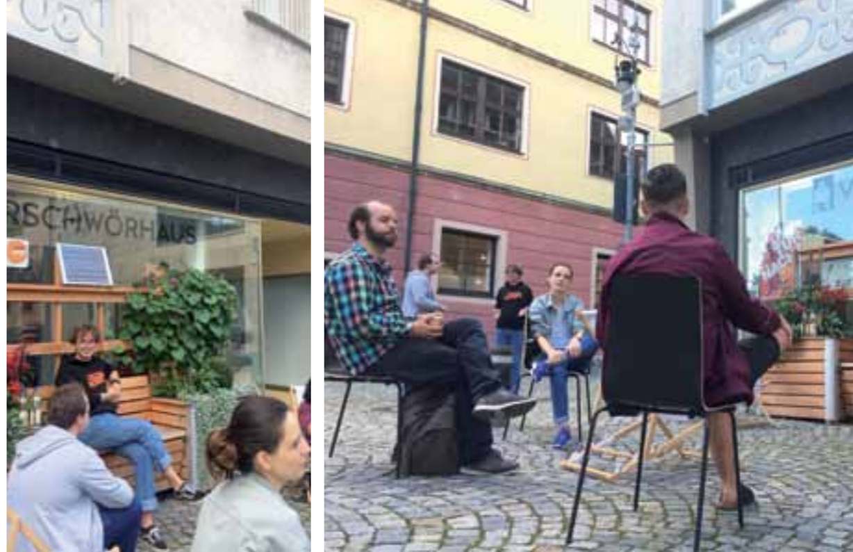
Bei uns waren um die zwanzig Leute da.