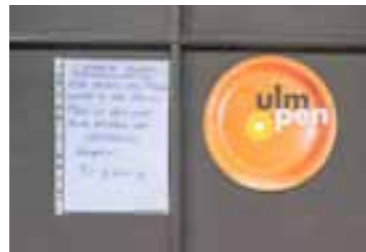
Gute Laune trotz Wetterumschwung