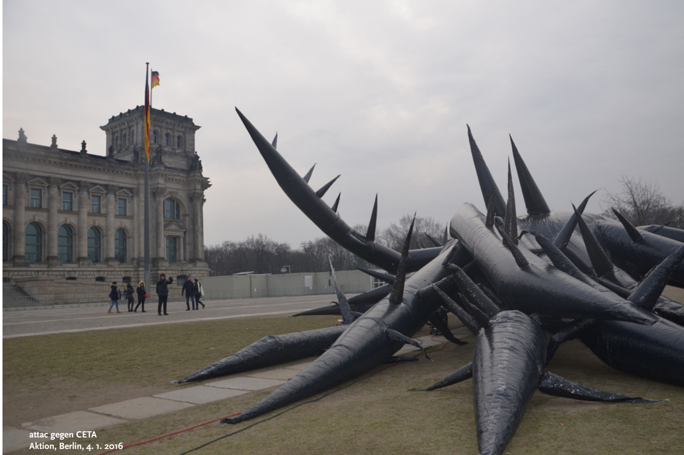
attac gegen CETA Aktion, Berlin, 4. 1. 2016