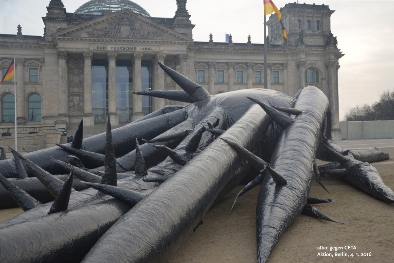
attac gegen CETA Aktion, Berlin, 4. 1. 2016